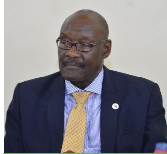
Hon. Dr. David Parirenyatwa