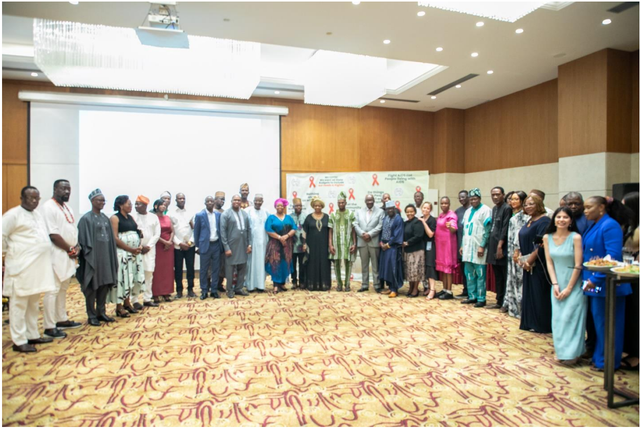
Coupe transversale des invités, du conseil d'administration de la SAA, du ministre de la Santé et du corps diplomatique