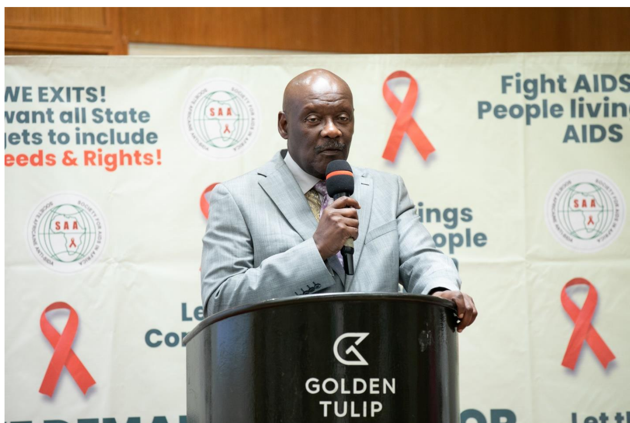
Hon. Dr. David Pagwesese Parirenyatwa, Président de la SAA lors de son allocution de bienvenue

Il a également remercié le Conseil d'administration de la SAA pour ses efforts continus et a appelé à un soutien continu pour parvenir à une Afrique sans SIDA d'ici 2030. En conclusion, il a exprimé sa gratitude à tous pour leurs contributions à la lutte contre le VIH au Bénin et dans le monde, en particulier pour les pays clés et populations vulnérables.